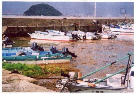
松浦川の河口の真正面に位置する「高島」には、松浦川からの流木・土砂の影響をまともに受ける。 (奥は「大島」)