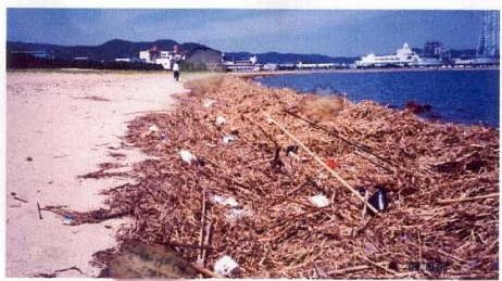
台風の翌日の西の浜海岸（写真上）及び東の浜海岸（写真下）の状況。松浦川河岸の草木が多く流失して来る。この後、湾内に広がり、その多くは海底に堆積する。